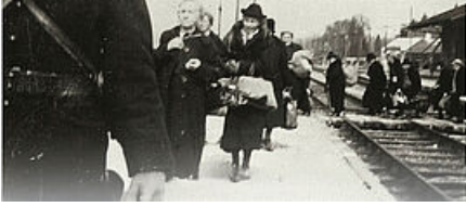
Départ pour la déportation depuis le camp de Nexon le 29 août 1942

Mais le grand choc, social, culturel, numérique, fut, dès la première semaine de septembre 1939 l'arrivée en gare de Périgueux des populations « repliées » du Bas-Rhin et de Strasbourg, soit un flot d'environ 80 000 personnes. Ce département, qui comptabilisait environ 387 000 habitants au recensement de 1936 accueillit jusqu'à 226.000 réfugiés au plus fort de ces mouvements de population, c'est-à-dire vers le mois d'août 1940. C'est ainsi que plusieurs milliers de Juifs se retrouvèrent en Dordogne, sans aucune possibilité de retour en Alsace, mais aussi cible désignée de la politique de persécution de Vichy et des nazis. En dépit de leur faible poids dans la population, environ 1,9%, leur surreprésentation dans le bilan des victimes est accablant. Les rendez-vous de l'Alsace et du judaïsme alsacien avec le Périgord constituent deux marqueurs forts que personne aujourd'hui n'oublie.