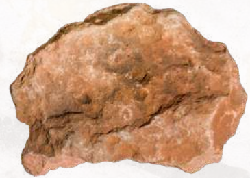
Une des nombreuses plaquettes calcaires aménagées en lampe.

Ils permettent, modestement, de nous rapprocher de la réalité d'une société humaine qui, par les questionnements qu'elle soulève, nous intrigue, nous fascine et nous inspire.