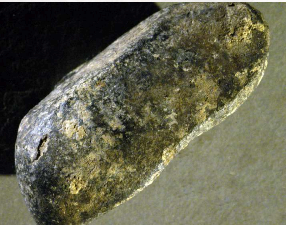
Crayon de manganèse. En haut, vue des traces de raclage.

Pour en savoir plus sur "les Mondes Invisibles" : [Communiqué de presse]