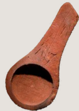
Lampe « brûloir » de Lascaux (dépôt du musée d'archéologie nationale de Saint-Germain-en-Laye).

En effet, le mobilier de Lascaux n'est présenté au public qu'au MNP. On y trouve une grande diversité d'objets, comprenant des pointes de chasse en bois de renne, des lampes en calcaire , dont la très célèbre lampe en grès rose décorée de signes, ainsi que des outils de peinture et de gravure utilisés par les artistes préhistoriques. Ils sont régulièrement réétudiés par des chercheurs grâce aux dernières technologies, permettant ainsi de mieux comprendre la société préhistorique.