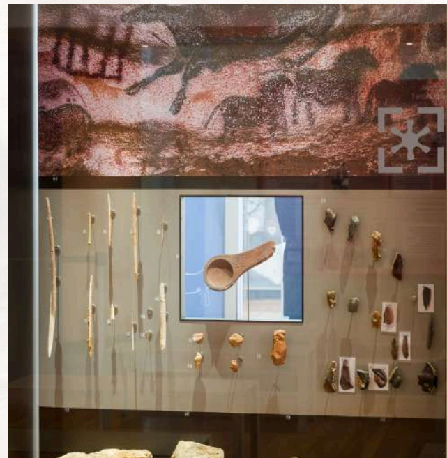
Les objets de Lascaux en vitrine, dans la galerie haute du musée national de Préhistoire.