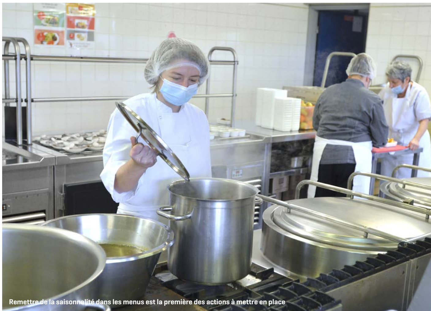
Remettre de la saisonnalité dans les menus est la première des actions à mettre en place