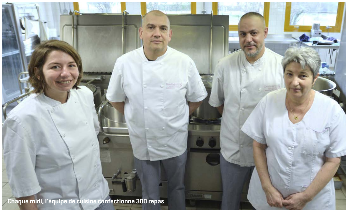
Chaque midi, l'équipe de cuisine confectionne 300 repas

Avec 4 établissements certifiés 100% bio et bénéficiant d'une alimentation locale et « faite maison », le Département de la Dordogne fait figure d'exception et d'exemplarité sur le territoire national. De nombreuses collectivités partout en France s'intéressent à la démarche initiée par le Conseil départemental pour ses collèges et souhaitent s'en inspirer.