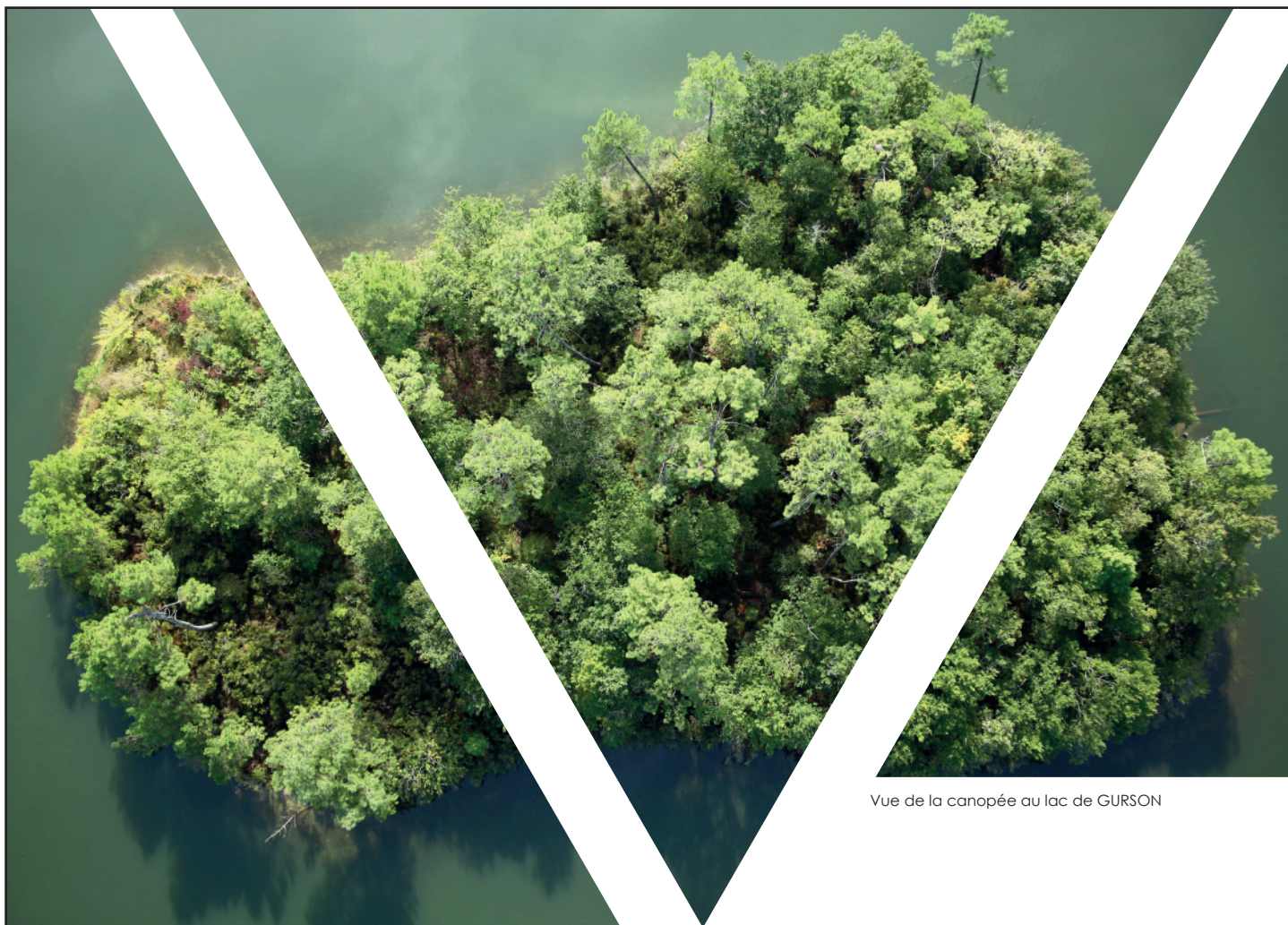
Vue de la canopée au lac de GURSON