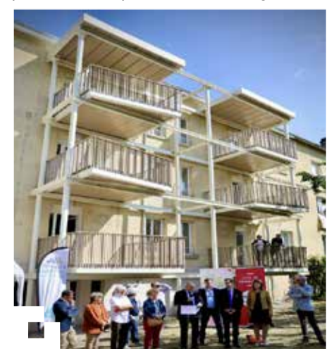
Résidence Ribot à Périgueux