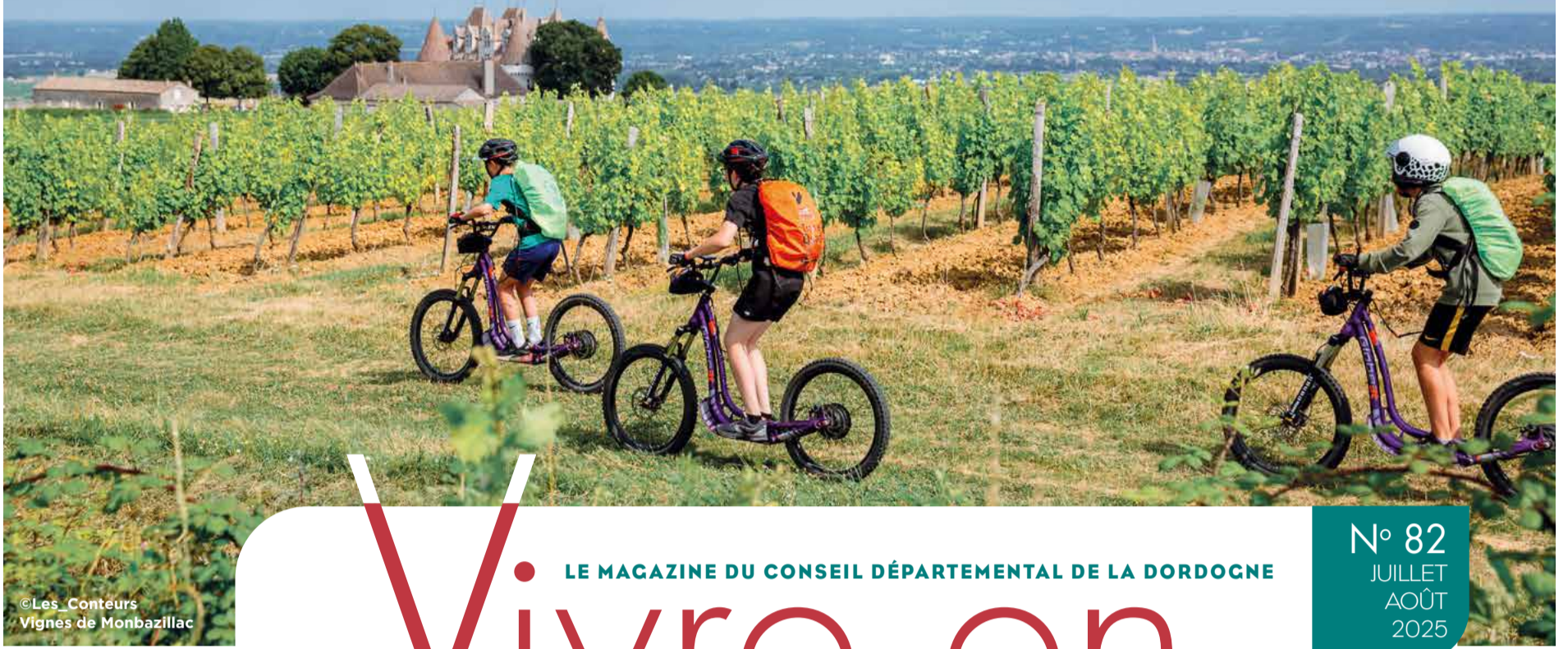
Vignes de Monbazillac

LE MAGAZINE DU CONSEIL DÉPARTEMENTAL DE LA DORDOGNE