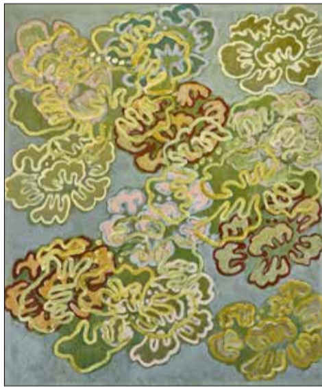
Monique Tello, Pivoines III, 2018 Collection BACT.L