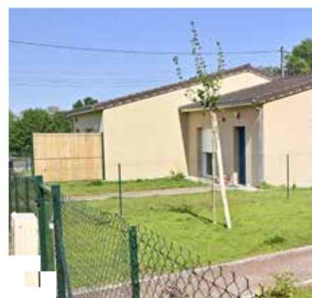
Lotissement des Amandiers à la Coquille

Avec plus de 9.400 logements sur 165 communes, Périgord Habitat loge aujourd'hui plus de 17.440 personnes en Dordogne.