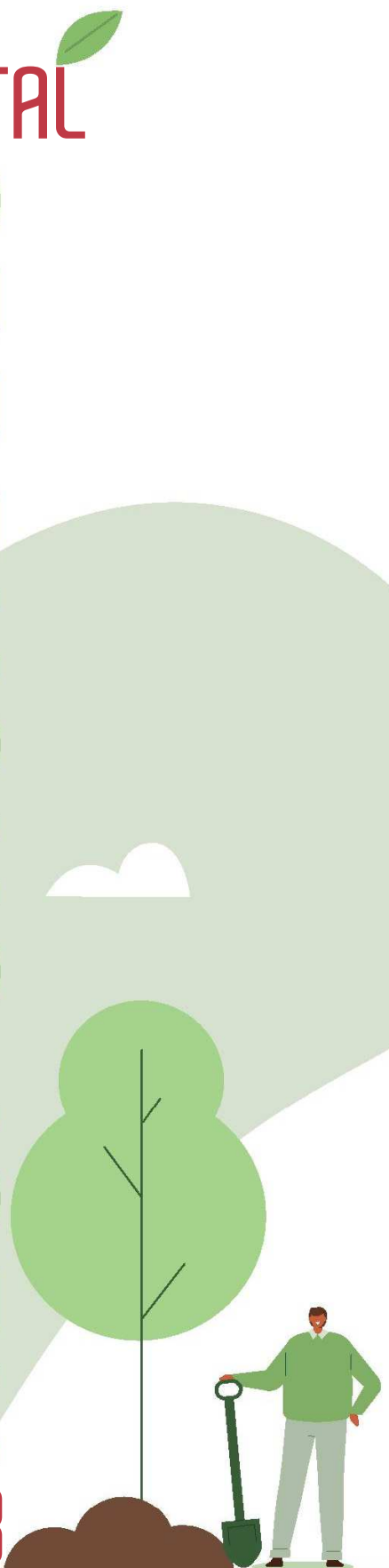
Schéma des ACHATS RESPONSABLES 2024-2028