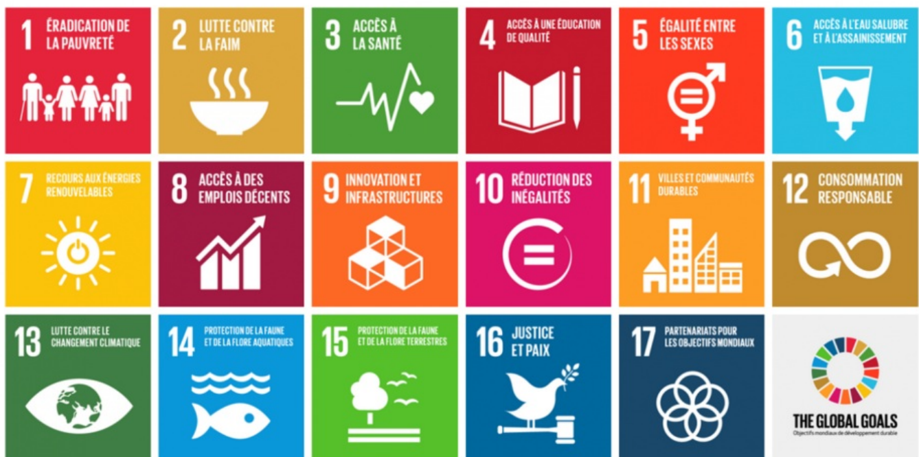
Les objectifs du Développement durable

D'autres exemples d'actions engagées par le Département sont décrits dans les rapports sur la situation en matière de développement durable que le Conseil départemental adopte chaque année depuis 2011.