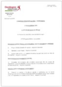
2024 Commission Permanente du 19 février 2024