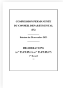
2023 Commission Permanente 20 novembre 2023