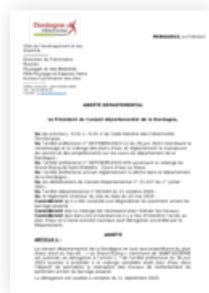
2023 Arrêté Départemental interdisant l'accès au plan d'eau de ST ESTEPHE ainsi que