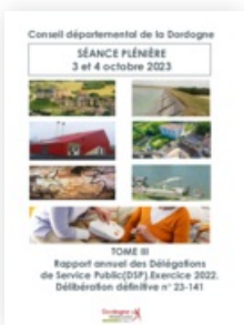
2023 Recueils de la séance plénière des 3 et 4 octobre 2023