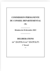
2023 Commission permanente 18 décembre 2023