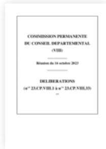
2023 Commission permanente 16 octobre 2023