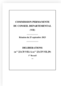
2023 Commission permanente 25 septembre 2023