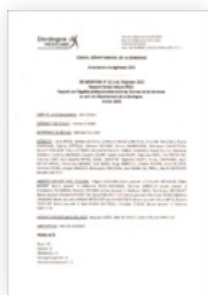
2020 Rapport social unique 2020