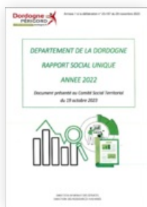
2022 Rapport social unique 2022